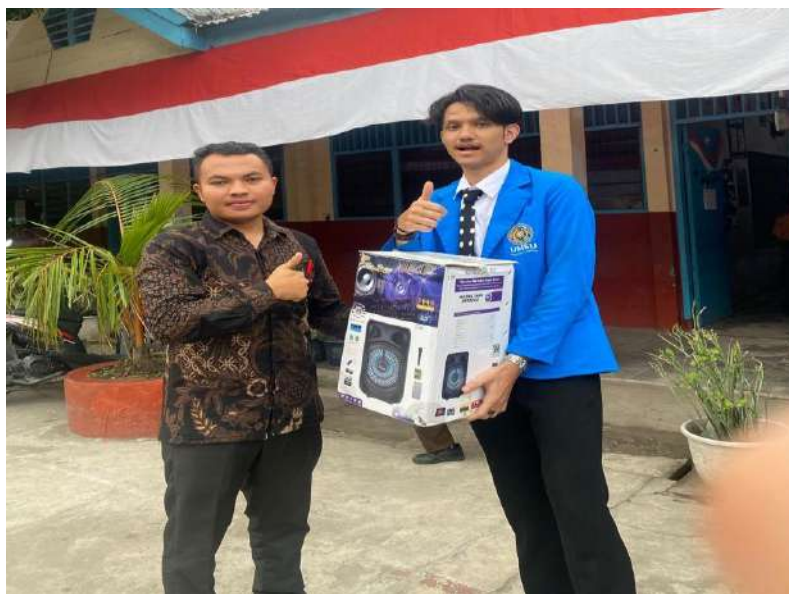
gambar 14 penyerahan cinderamata