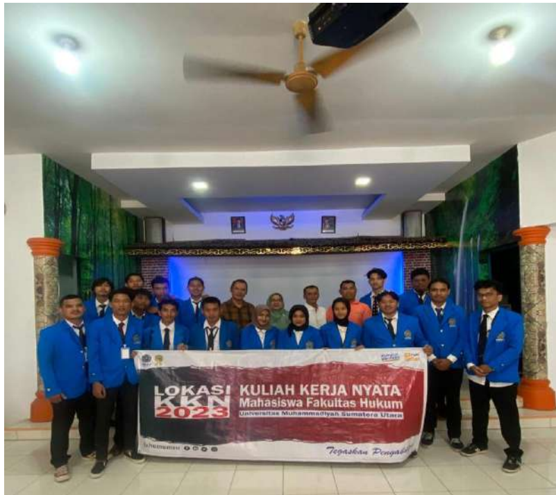
gambar 18 foto bersama