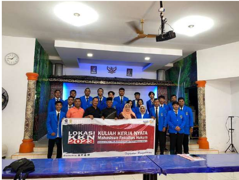
gambar 3 pelepasan mahasiswa KKN