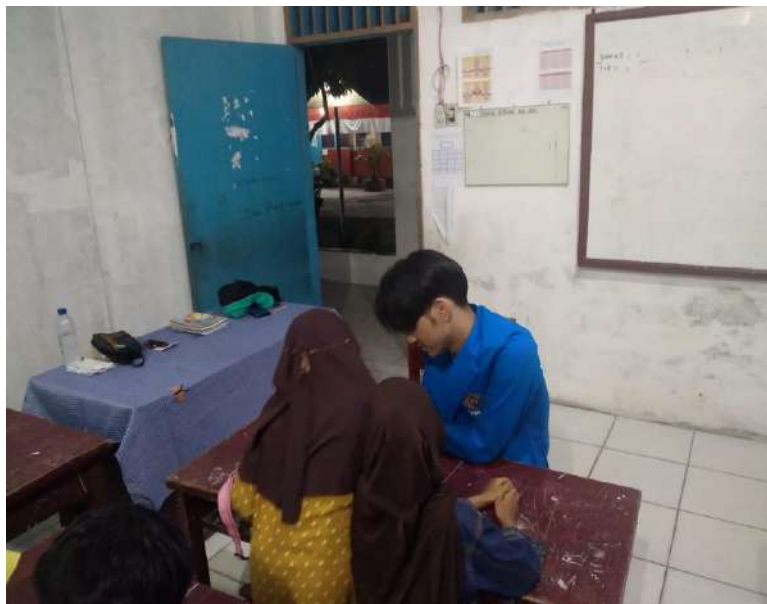
gambar 12 belajar mengaji