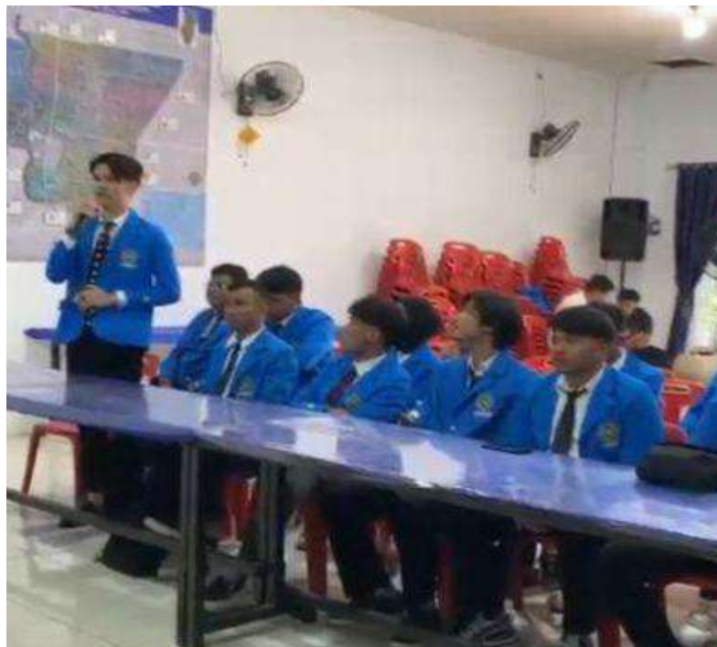
gambar 4 kata sambutan oleh ketua kelompok