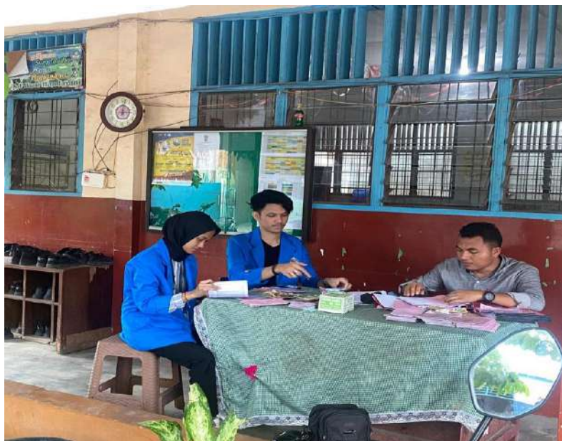
gambar 8 administrasi