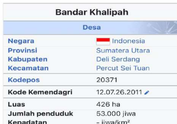
gambar 2

Bandar Khalipah adalah sebuah desa di Kecamatan Percut Sei Tuan, Kabupaten Deli Serdang, Provinsi Sumatera Utara, Indonesia. Desa Bandar Khalipah yang memiliki 11.864 kepala keluarga menjadi desa pemukiman terpadat di Provinsi Sumatera Utara . Desa Bandar Khalipah Terbagi Menjadi 17 dusun Dan 143 RT.