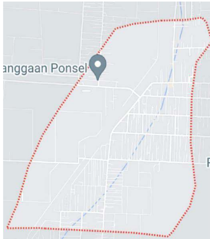
gambar 1 denah lokasi

Bandar Khalipah adalah sebuah desa di Kecamatan Percut Sei Tuan, Kabupaten Deli Serdang, Provinsi Sumatera Utara, Indonesia. Desa Bandar Khalipah yang memiliki 11.864 kepala keluarga menjadi desa pemukiman terpadat di Provinsi Sumatera Utara . Desa Bandar Khalipah Terbagi Menjadi 17 dusun Dan 143 RT.