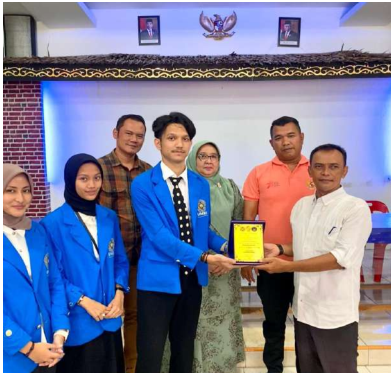
gambar 16 penyerahan pelakat ke perangkat desa