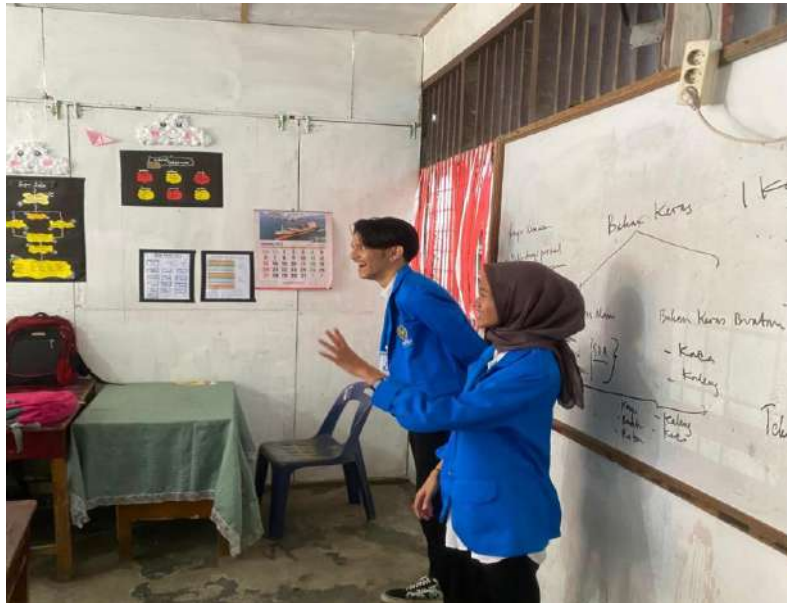
gambar 7 menjelaskan program kerja