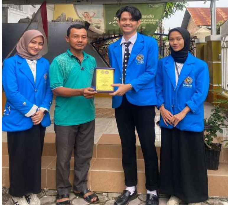
gambar 17 penyerahan pelakat ke kepala dusun