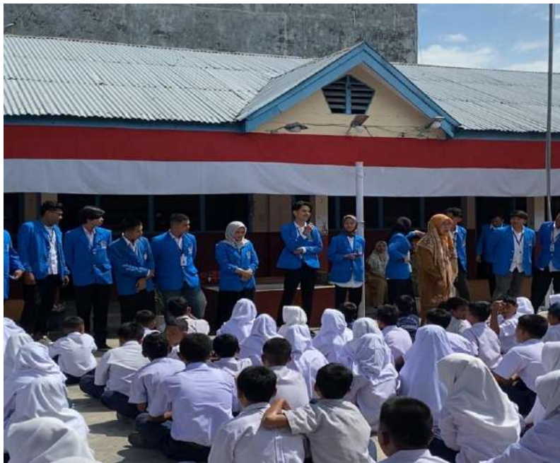
gambar 6 pengenalan mahasiswa kepada siswa-siswi