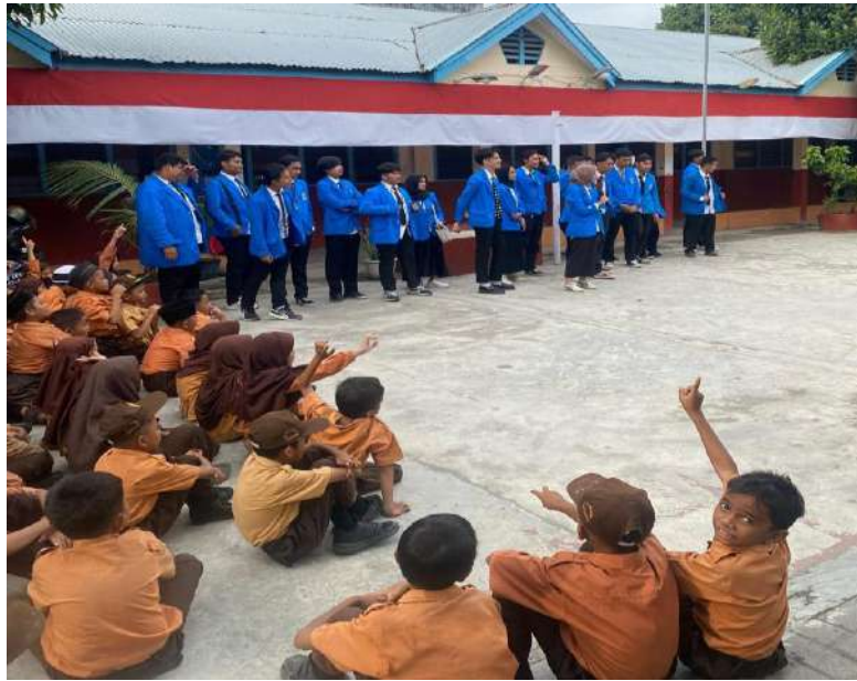
gambar 13 acara penutup