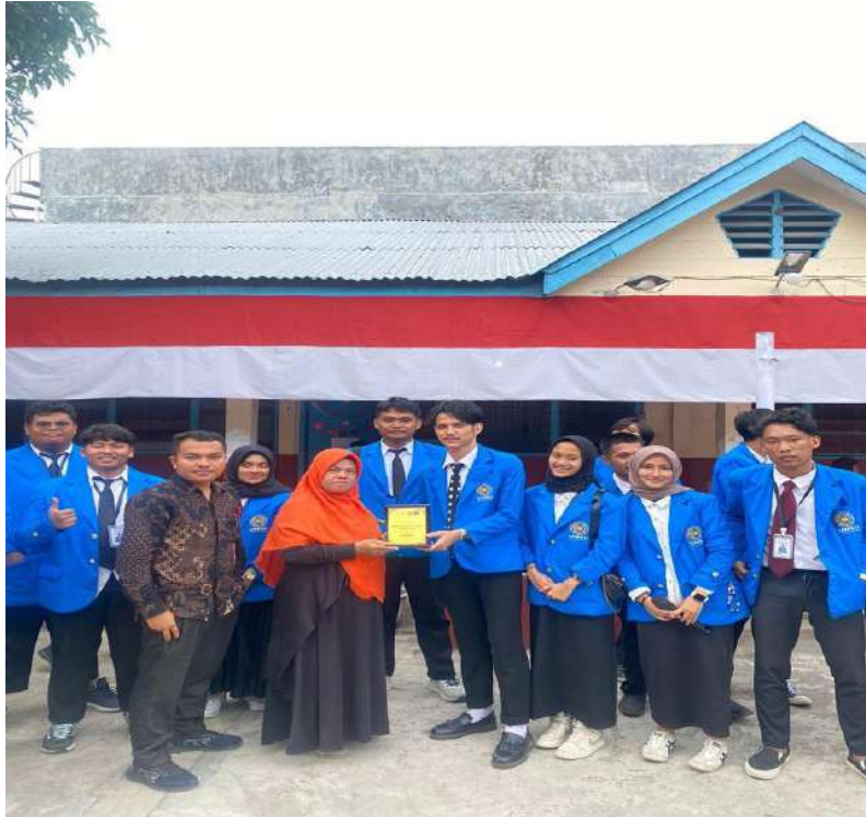
gambar 15 penyerahan pelakat ke sekolah