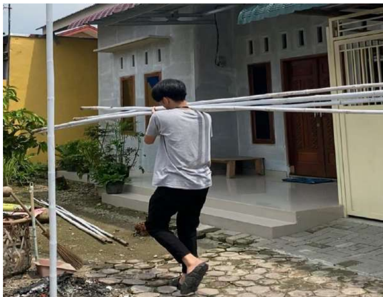
gambar 10 gotong royong