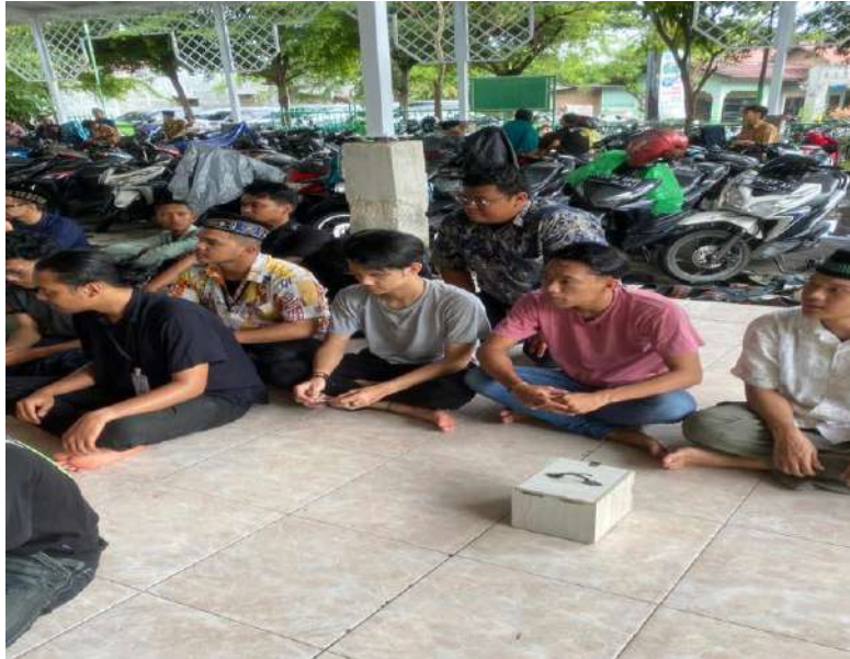
gambar 11 salat jumat