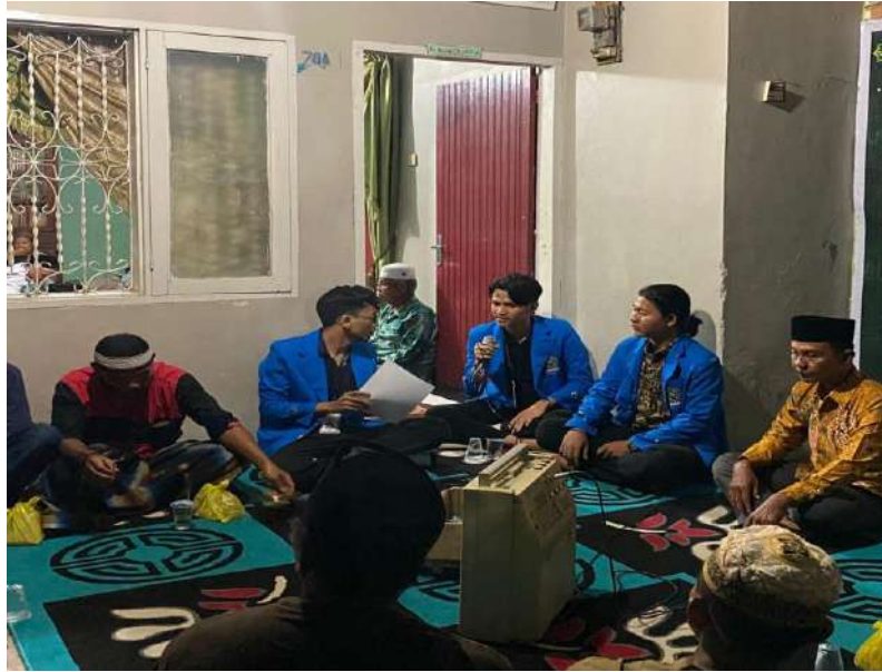
gambar 5 penyuluhan hukum