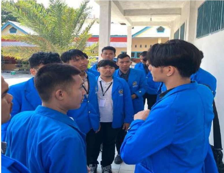
gambar 9 briefing